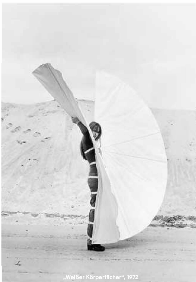
„Weißer Körperfächer“, 1972