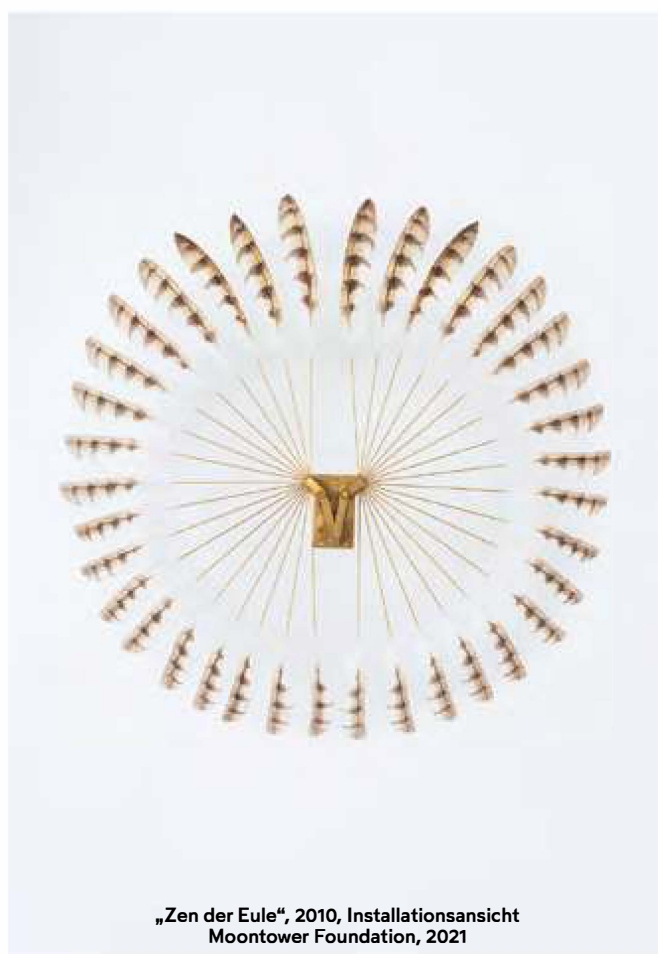
„Zen der Eule“, 2010, Installationsansicht Moontower Foundation, 2021