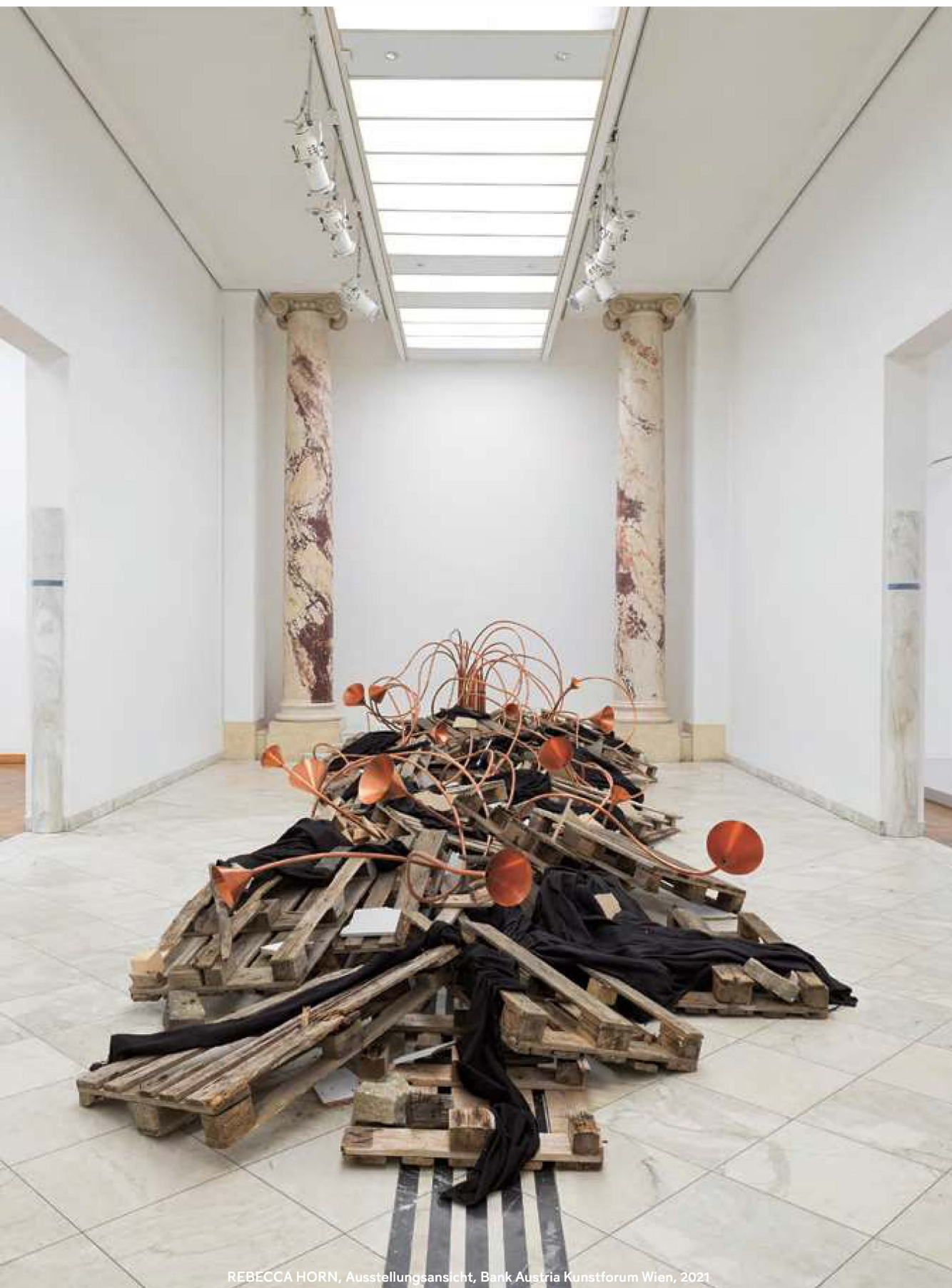
REBECCA HORN, Ausstellungsansicht, Bank Austria Kunstforum Wien, 2021

»SIE HAT UNS ANGEHALTEN, NIEMALS BEIM ERSTEN BILD, BEIM ERSTEN EINFALL STEHEN ZU BLEIBEN«