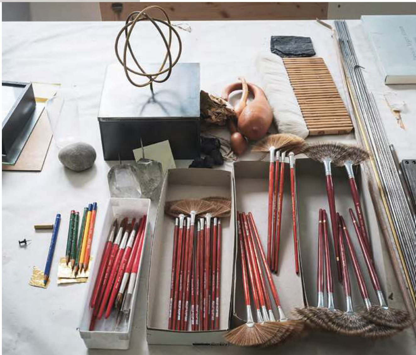
Arbeitsmaterialien in REBECCA HORNS Atelier

Fotos: Wolfgang Stahr, © Rebecca Horn, VG Bild-Kunst, Bonn 2021