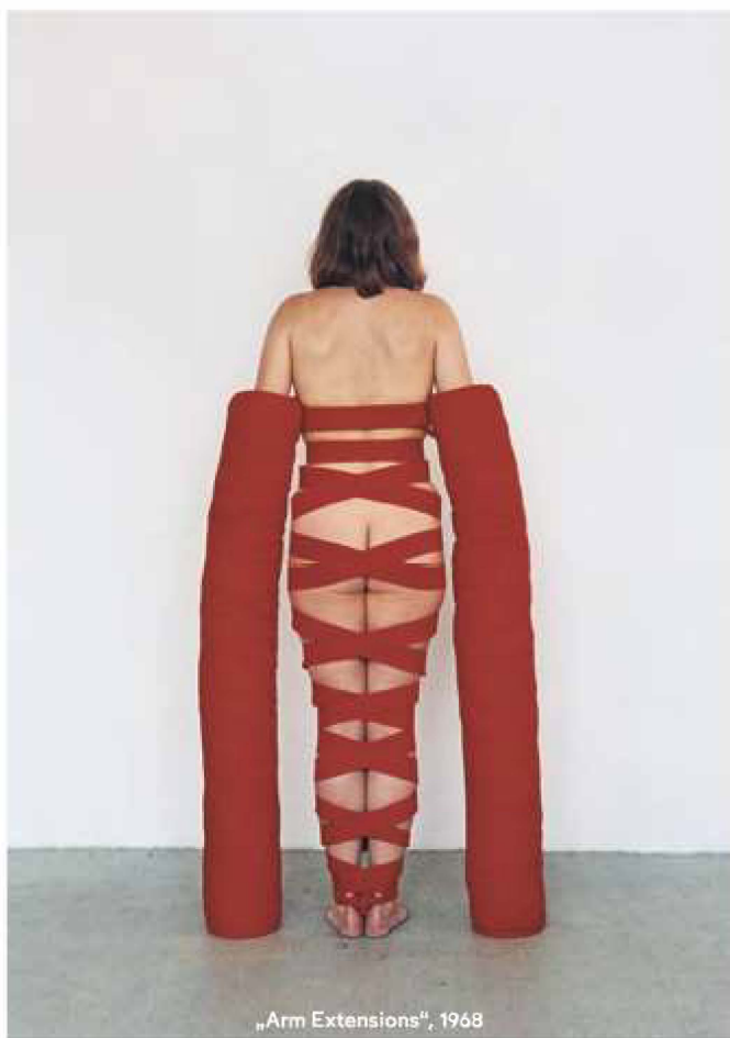
„Arm Extensions“, 1968