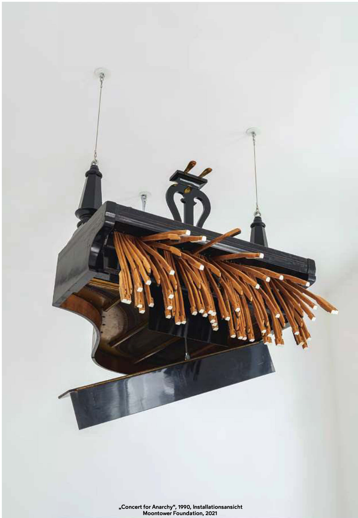
„Concert for Anarchy“, 1990, Installationsansicht Moontower Foundation, 2021

»DER TRAGISCHE ODER MELANCHOLISCHE ASPEKT DER MASCHINE IST MIR WICHTIG«