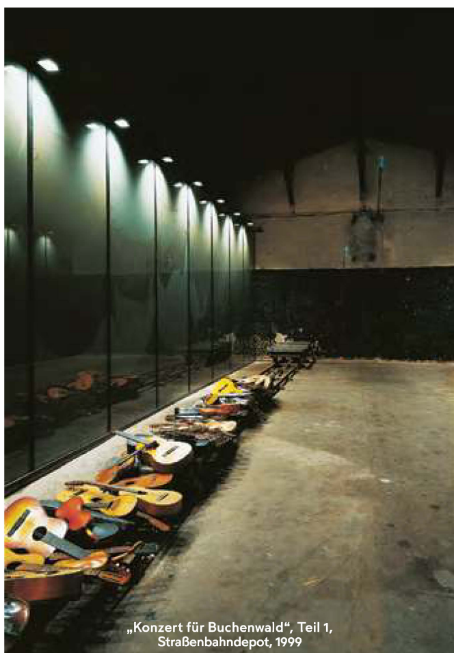
„Konzert für Buchenwald“, Teil 1, Straßenbahndepot, 1999