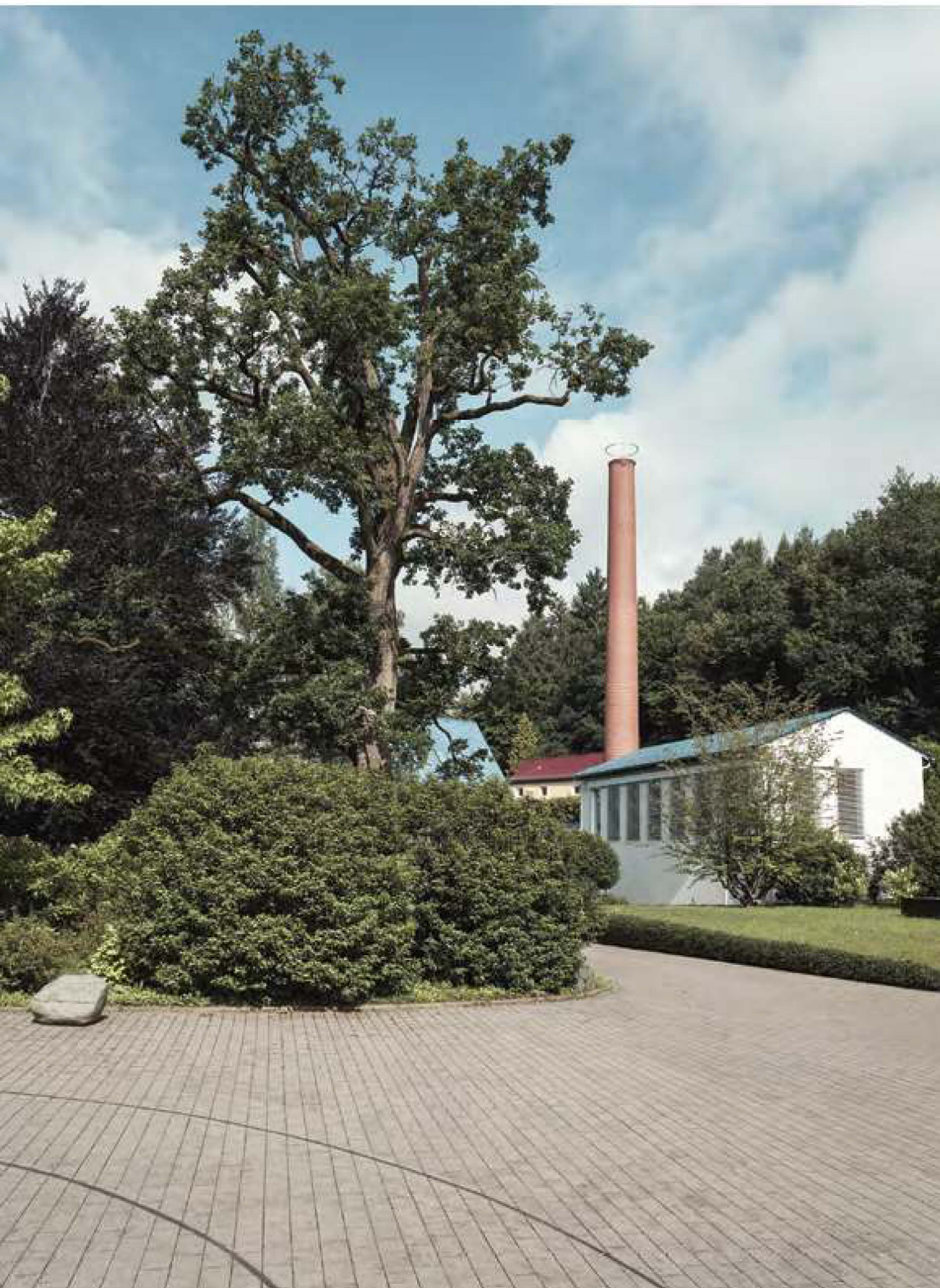
Das Gelände der MOONTOWER FOUNDATION war früher eine Textilfabrik und eine Molkerei und schon einmal im Besitz von Rebecca Horns Familie gewesen