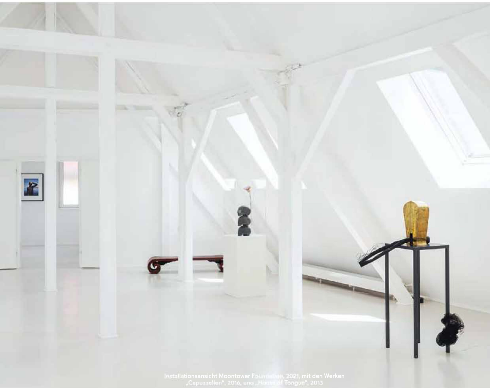
Installationsansicht Moontower Foundation, 2021, mit den Werken „Capuzzellen“, 2016, und „House of Tongue“, 2013