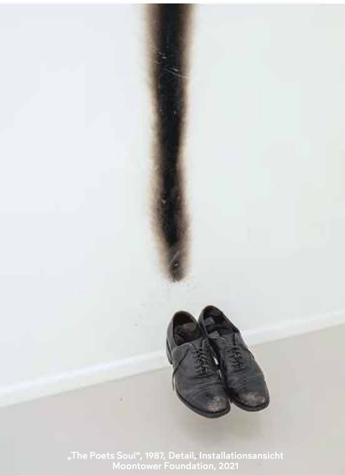
„The Poets Soul“, 1987, Detail, Installationsansicht Moontower Foundation, 2021

Sie ist eine von vielen seltsamen Maschinen, die Rebecca Horn vor allem seit den 1980er-Jahren gebaut hat. Manche schleudern Farben an die Wände oder auf Bücher oder drücken zitternde Stifte auf weißes Papier, als Zeichen- und Malmaschinen, die in einer mechanischen Écriture automatique die Rolle der Künstlerin einnehmen. Manche spreizen ihre Federn wie mechanische Pfauen oder lassen Messer tanzen. Wie Maschinen übernehmen, wenn die Menschen die Szene verlassen haben – wie in Horns Film „Eintänzer“, den sie 1978 in New York drehte: Dort tanzt am Ende ein Tisch im leeren Ballettstudio Tango. „Meine Maschinen sind keine Waschautomaten. Sie besitzen fast menschliche Eigenschaften und müssen sich auch verändern. Sie sind nervös und müssen auch manchmal innehalten. Wenn eine Maschine nicht mehr weiterläuft, bedeutet das nicht, dass sie kaputt ist, sie ist nur erschöpft. Der tragische oder melancholische Aspekt der Maschine ist mir wichtig. Ich will gar nicht, dass sie ewig funktionieren.“