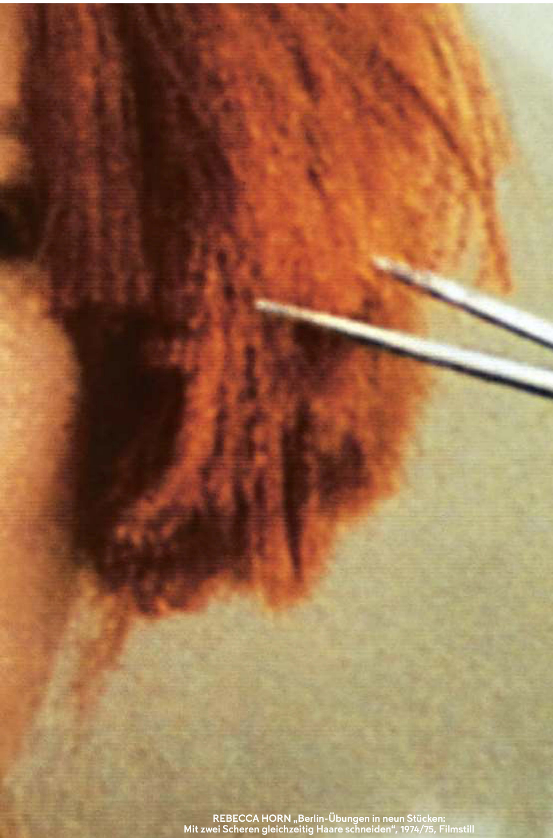
REBECCA HORN „Berlin-Übungen in neun Stücken: Mit zwei Scheren gleichzeitig Haare schneiden“, 1974/75, Filmstill