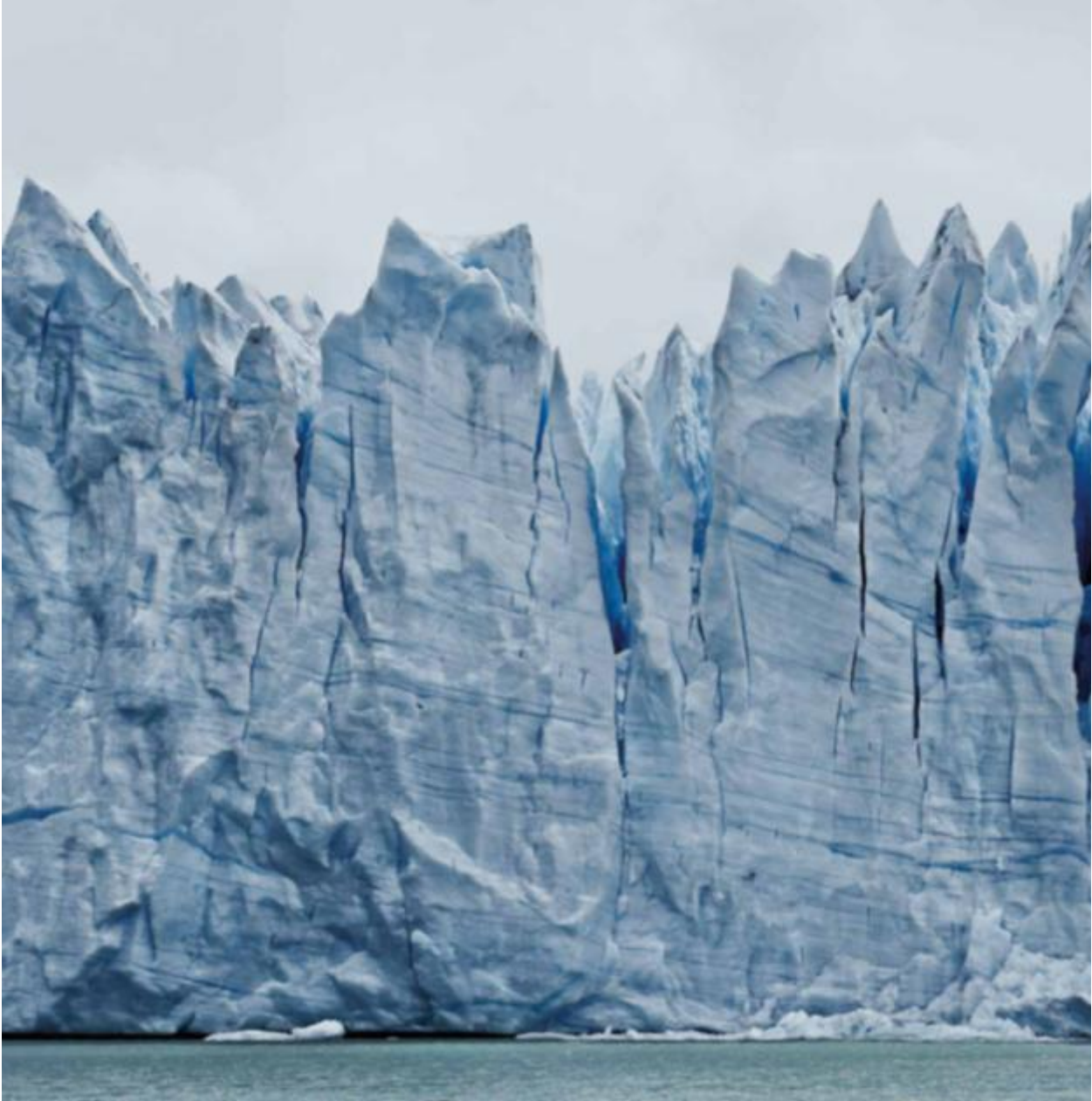
PERITO MORENO #16 VORHERIGE SEITE: PERITO MORENO #11