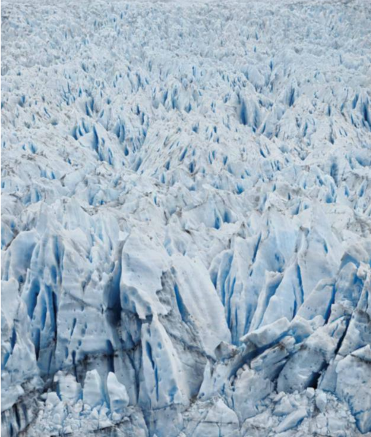
PERITO MORENO #04